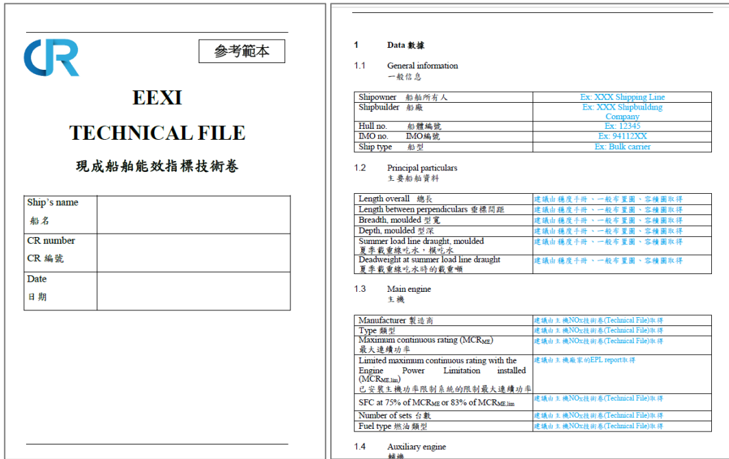
圖 4、驗船中心已依據本決議案，製作中英文之 EEXI 技術卷範本供各界取用

三、除非船舶的 EEXI 已經符合 EEDI 的要求，為驗證 EEXI，應向驗證人員提交檢驗申請、EEXI 技術卷及其他相關背景檔案。關於 EEXI 技術卷的範本置於本準則的附件，供各界參考。